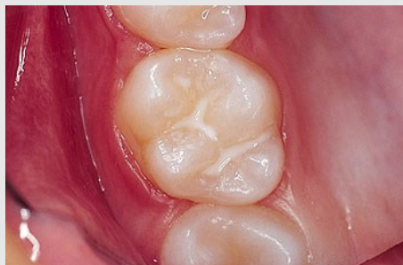
Schutz vor Karies: Versiegelung der feinen Grübchen auf der Kaufläche

Bei der Versiegelung werden die Fissuren mit einem hellen Kunststoff dauerhaft verschlossen, so dass an diesen Stellen keine Karies mehr entstehen kann (siehe Abb. unten).