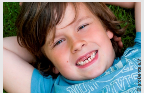
Bei der Prophylaxe lernen Ihre Kinder die richtige Zahnpflege

Es gibt also keinen Grund, warum Sie auf Prophylaxe für Ihre Kinder verzichten sollten.